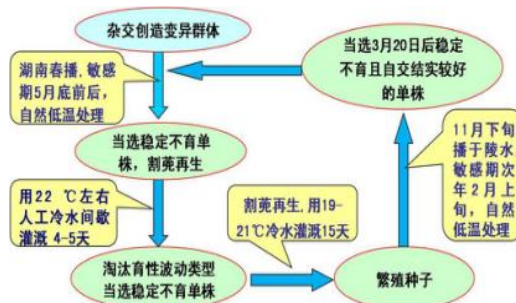
图1 自然低温和人工低温双重压力胁迫选择法

1993 年，项目组在籼粳亚种间杂交组合“抗罗早///科辐红 2 号/湘早籼 3 号//02428 粳”F 2 中发现 1 株温敏雄性不育新资源，研创出“自然低温和人工低温双重压力胁迫选择法”对其进行多代育性定向筛选（图 1），即将该资源反复置于海南 3 月中上旬、湖南 5 月底前后的频繁自然低温环境和 7-8 月间湖南的人工低温（低温水串灌）环境下对育性进行高压胁迫筛选，彻底淘汰不育起点温度高、对低温敏感的基因型，同时强化了育性敏感期耐冷性锻炼，于 1996 年培育出不育起点温度 < 22.6℃、耐受低温历期